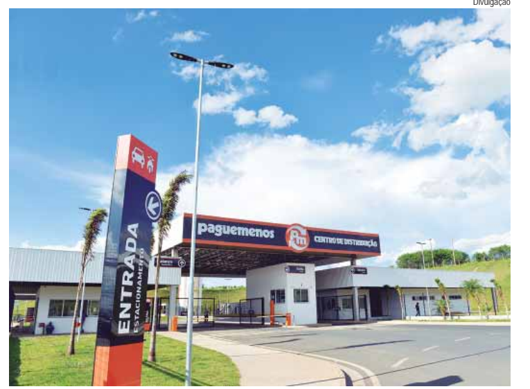
Indaiatuba já conta com uma unidade, localizada na rua Três Marias, número 736, bairro Cidade Nova

A primeira unidade da Rede de Supermercados Pague Menos em Indaiatuba foi inaugurada em 2008, e conta com mais de 200 colaboradores. Já são 16 anos presentes no município, contribuindo para o desenvolvimento econômico, geração de empregos, além de oferecer toda qualidade e tradição de 35 anos do Supermercados Pague Menos. "Cada loja que inau-