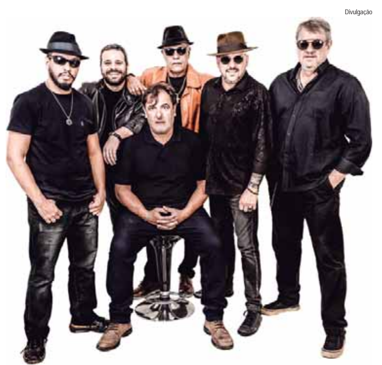
A 11ª edição do evento gastronômico conta com uma programação musical diversificada, além de pratos que misturam tradição e inovação

O Brotas Gourmet chega à sua 11ª edição com uma programação musical diversificada, prometendo agradar a todos os públicos. Com apresentações que vão do pop ao rock, o festival oferece mais do que pratos saborosos e oferece uma trilha sonora envolvente para complementar a experiência gastronômica dos visitantes.