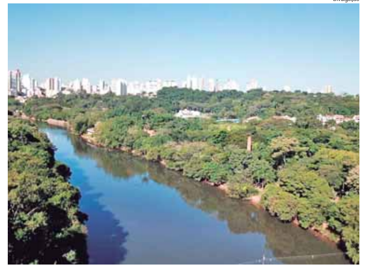
O montante tratado equivale a cerca de 16 mil piscinas olímpicas

A Mirante é uma empresa da Aegea Saneamento, líder no setor