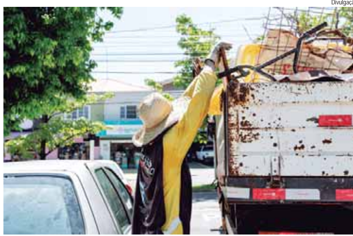
Arrastão da dengue passará por dez bairros na região do Vila Sônia no sábado, 17-08

VACINAÇÃO – A aplicação da vacina contra a dengue em crianças e adolescentes na faixa etária entre 10 e 14 anos segue em Pi-