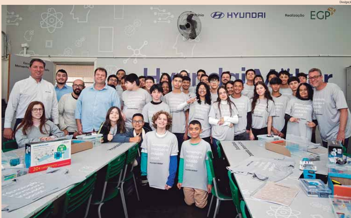
HYUNDAI — Projeto foi anunciado na terça-feira (13): iniciativa proporcionará a alunos da rede pública de ensino espaços para estudos de robótica e programação. A7