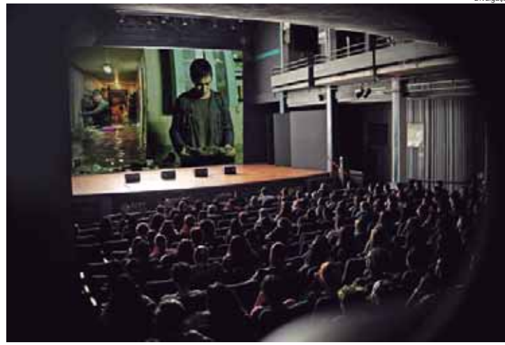
Evento acontece até o domingo, dia 18, no Teatro do Engenho

"A principal característica do cinema sul-coreano, e talvez um dos segredos de seu sucesso, é a capacidade de aliar uma produção forte e vigorosa com temas relevantes no mundo contemporâneo. Esse