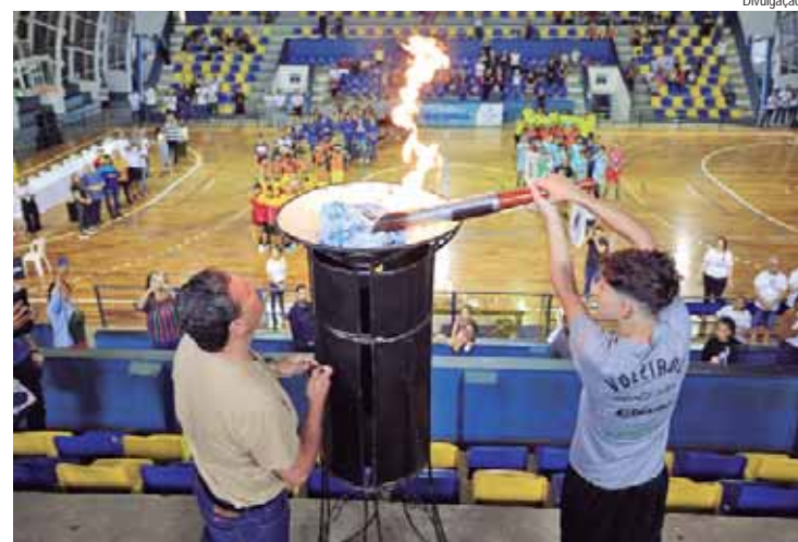
Competição reúne atletas do sub-14 de várias cidades da Região Metropolitana de Piracicaba

As competições serão realizadas nas dependências do Ginásio do Parque Prezotto, no Ginásio de Esportes José de Oliveira Garcia Neto, no Ginásio Municipal de Esportes Waldemar Blatkauskas, no