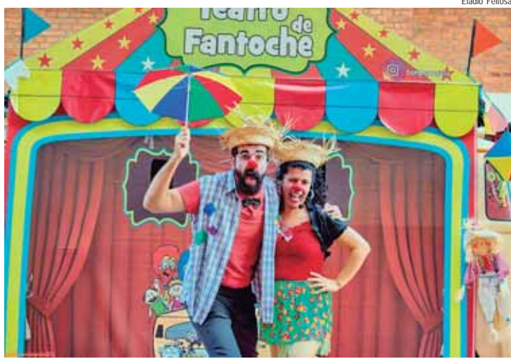
Tampa e Panela levam o Circo na Kombi a Santa Teresinha