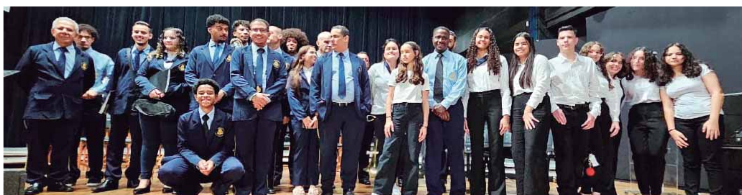
Integrantes da Corporação Musical União Operária de Piracicaba