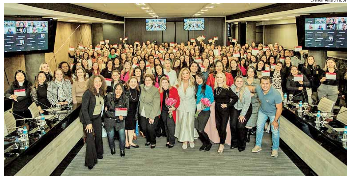
Em sua 4ª turma, entidade registrou aumento de 110%. No total, 685 mulheres foram mentoradas nas quatro edições

te do Confem, há espaço para o programa seguir crescendo. "A busca pela equidade de gênero continua, mas é preciso incluir ainda mais mulheres pretas e pardas nas próximas turmas. Continuaremos trabalhando para tornar isso realidade", disse.