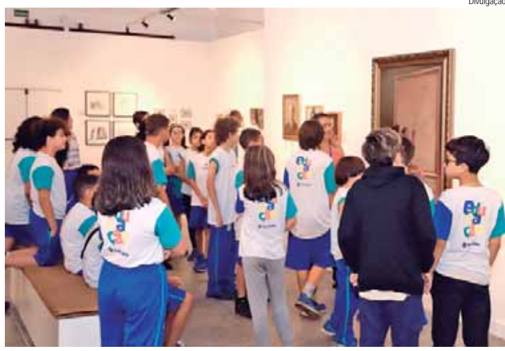
O objetivo é promover uma experiência cultural enriquecedora aos alunos da rede municipal