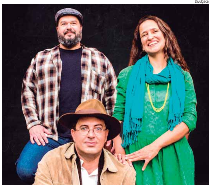
"Go Back CV" acontece no próximo sábado, 17, na Tutta Birra

"Ele teve todo um tratamento intensivo e agora está em ou-