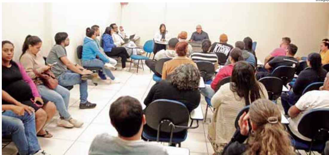
Evento é realizado em Rio das Pedras desde a década de 1980

E na segunda feira passada aconteceu a reunião com os comerciantes interes-