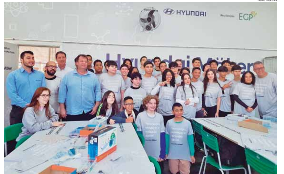
Projeto foi anunciado terça (13): iniciativa que proporcionará a alunos da rede pública de ensino em Piracicaba espaços para estudos voltados à robótica e programação

"O projeto usa a metodologia maker para desenvolver as habilidades emocionais que ajudam os jovens a se tornarem agentes de transformação, seja no ambiente familiar, escolar, comunitário e, futuramente, no profissional. Além da parte técnica, as oficinas também irão estimular o pensamento crítico, colaboração, comunicação efetiva e habilidades empreendedoras, competências essenciais para que esses jovens sejam capazes de