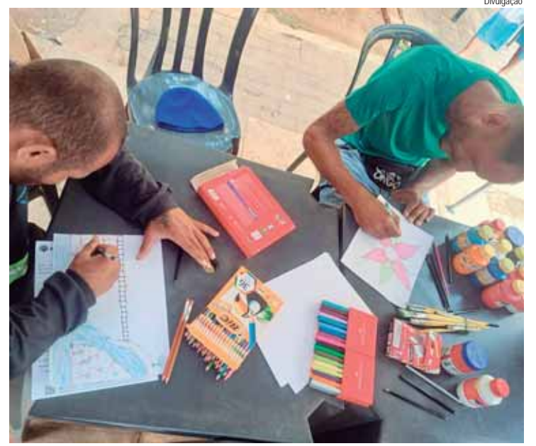
Usuários participam da oficina de arte durante café cultural