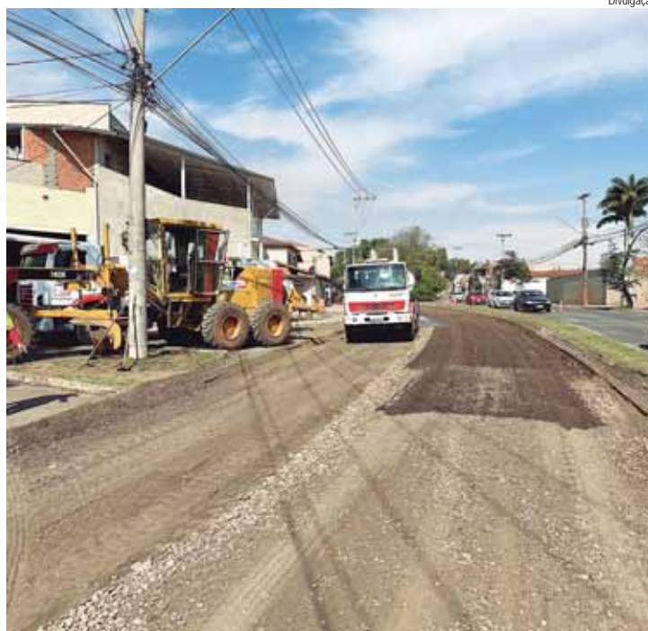
As obras estão concentradas no trecho da rotatória da ponte do Cachão até a rotatória da rua Claudelis Aparecida Nolasco

Além da maior durabilidade, o pavimento em concreto diminui o custo com manutenção de veículos e a possibilidade de ocorrência de acidentes, agiliza o trânsito e diminui a poluição, pois não deforma quando há aceleração, frenagem e provas de cargas dos veículos, além de necessitar menor interferência de manutenção preventiva e corretiva.