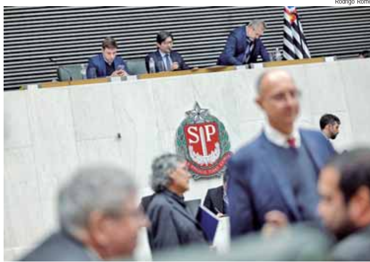
Propostas atualizam carreiras do funcionalismo público e criam novos cargos de procurador de justiça e de auditor de controle externo

Já o PLC 38/2024, de autoria do Tribunal de Contas do Estado, reestrutura o quadro de pessoal do órgão, com a extinção de 141 funções e a criação de 34 novos cargos. O PLC 39/2024, por sua vez, prevê a criação de 37 cargos de auditor de controle externo do TCE-SP, que serão providos por meio de concurso público.