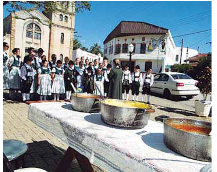
A Festa da Polenta, uma das tradições do bairro