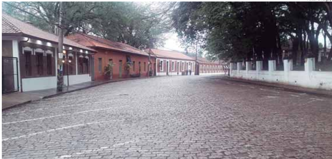
Ciclovia deve passar em trecho de paralelepípedo da avenida Comendador Pedro Morganti