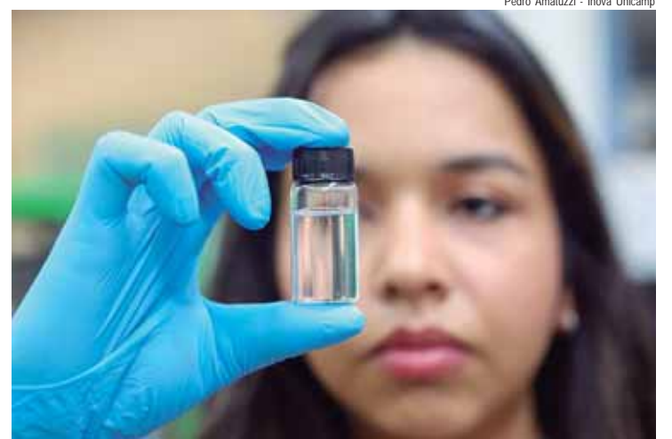
Dentre os pilares avaliados pelo INPI estão indicadores promovidos no ecossistema da Universidade Estadual de Campinas e fomentados pela Agência de Inovação da Unicamp