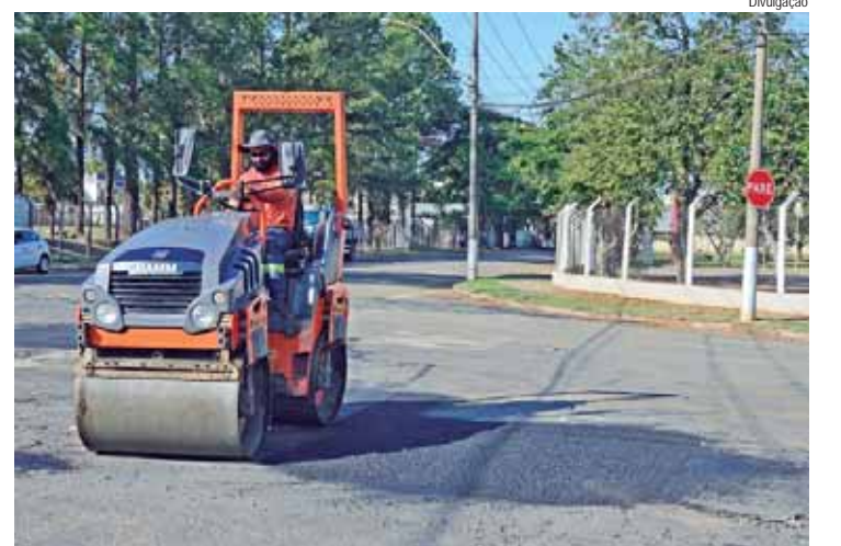
Unileste foi um dos 14 bairros que receberam serviços de tapa-buraco na última semana

BAIRROS E VIAS ATENDIDAS: ÁGUA BRANCA: rua Antonio Bombo; Altos da Pompeia: rua Arduce Honório de Aguiar; Cecap: avenida Romeu Italo Ripoli; Glebas Califórnia: rua Manaus; Ipanema: rua Carlos Coxa e rua Vitor Pexe; Jaraguá: rua Porto Feliz e rua Professor Raul Duarte; Jardim Planalto: rua Estér Weiser e rua Hercolino Mônaco; Jardim São Francisco: rua Cristiano Mathiensen; Jardim São Jorge: rua Helly de Campos Melges; Jardim Vitória: rua Antonio Lico; Javary I: rua Açai, rua José Alves Tobias e rua Luiz Delfini; Nova Piracicaba: rua Dr. Celso Galdino Fraga e rua Luther King; Santa Teresinha: rua