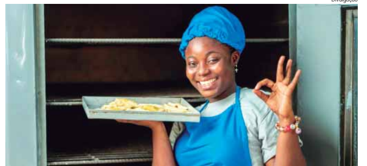
Em parceria com o Sebrae, a aula apresenta técnicas e dicas para ampliar o apelo visual, atrair clientes e aumentar suas vendas

Com o objetivo de auxiliar os microempreendedores de todo o Brasil no aprimoramento da comunicação de seus negócios, o Instituto Assai, por meio do programa Academia Assai, em parceria com o Sebrae, realizará no dia 20 de agosto o curso online e gratuito "Fotografia de alimentos para empreendedores".