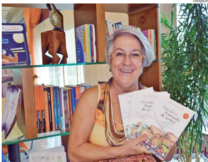
Após a contação, os participantes poderão confeccionar sua própria boneca Caju