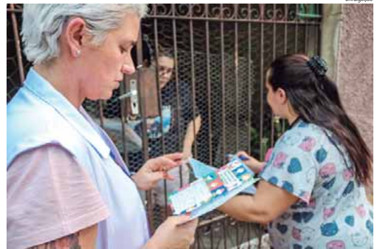
Equipes de saúde fazem visita em horário alternativo para falar com pais e mães sobre a vacinação contra sarampo e polio

A enfermeira responsável pela USF Bosques do Lenheiro 1 destacou que o Monitoramento das Estratégias de Vacinação vem para reforçar e contribuir para o