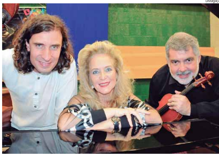
Apresentação do trio piracicabano é domingo (18), às 10h, ao ar livre, no teatro de arena da Casa do Povoador

Ternamente Eclético. Domingo, 18/08, às 10h, no teatro de arena da Casa do Povoador. Avenida Beira Rio, sem número. Entrada gratuita. Informações: 3403-2600.